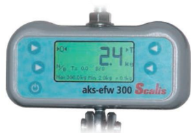
optie: digitale weegschaal