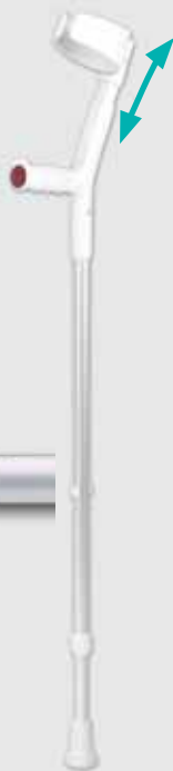
Artikel o R120.00.10