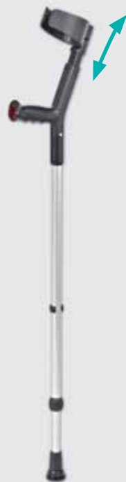
Artikel o R120.10.10