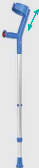
Artikel o R120.50.10