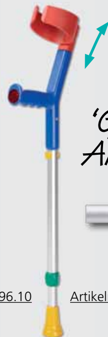
Artikel o R122.95.10